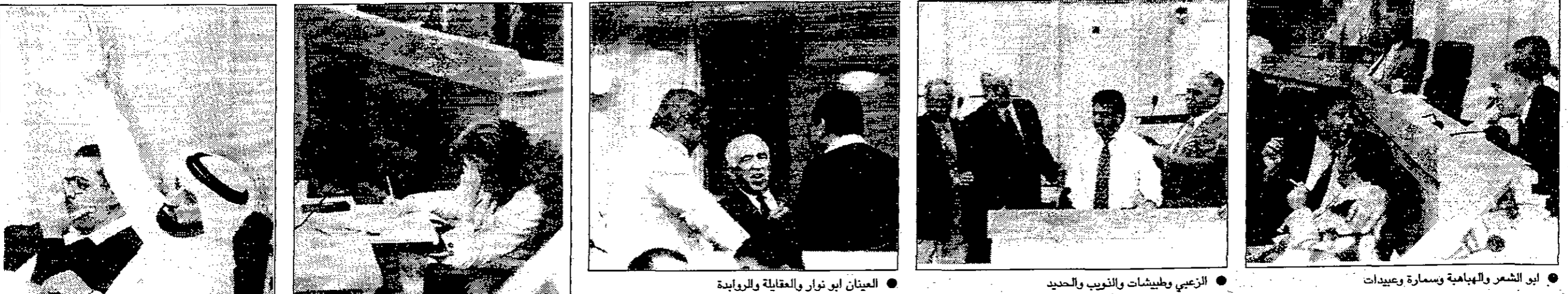
إبر الشعر والبهابة وسمارة وعبيدات • الزعي وبغيشات والنوب والحديد • العيان ابو نوار والمقالبة والروابدة